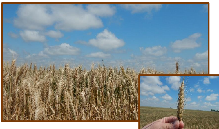
Fotos tomadas el 2/11/2017 a 5 km al sur de Comechingones, departamento Río Primero.

Trigo. Estado general Excelente. Fenología: Z.8 (grano pastoso). Cultivo bajo sistema de riego. No se observaron plagas y enfermedades.