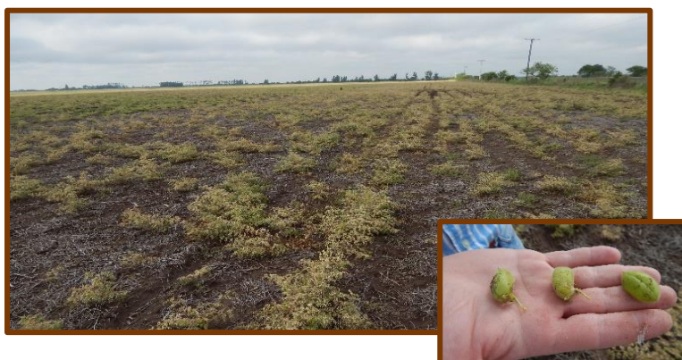
Fotos tomadas el 2/11/2017 a 6 Km al oeste de Villa Fontana, departamento Río Primero.

Garbanzo. Estado general regular-malo. Fenología: R5 (Inicio de formación de semillas). En cuanto al estado sanitario no se observaron plagas y enfermedades. Stand de plantas muy disminuido por las heladas de junio y julio de 2017.