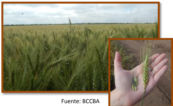
Foto tomada el 08/11/2016 a 6,5 km al Noreste de la localidad de Villa del Rosario, Dpto. Río Segundo.

Trigo. Estado general Muy Bueno. Fenología: Grano pastoso. No se observaron plagas y enfermedades.