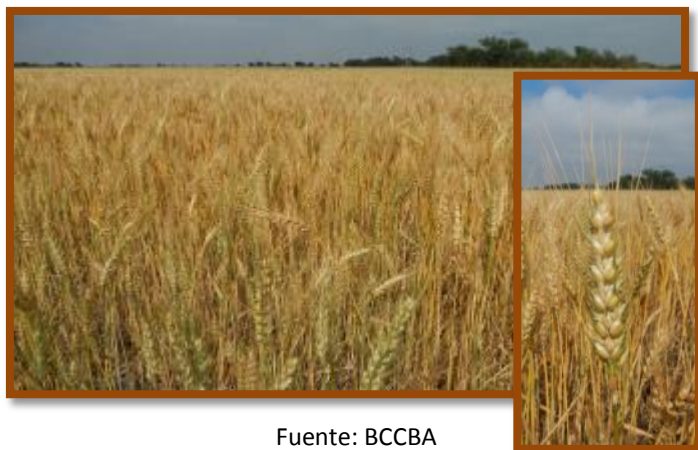
Foto tomada el 08/11/2016 en la localidad de Capilla del Carmen, Dpto. Río Segundo.