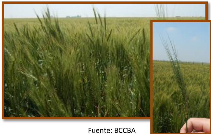
Foto tomada el 08/11/2016 a 9 km al Norte de la localidad de Calchín Oeste, Dpto. Río Segundo.

Trigo. Estado general Muy Bueno. Fenología: Grano lechoso. No se observaron plagas y enfermedades.