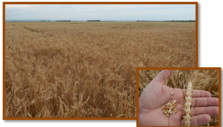
Foto tomada el 07/11/2016 a 2 km al Oeste de la localidad de San Vicente, Dpto. San Alberto.

Trigo pan bajo riego. Estado general Muy Bueno. Fenología: grano pastoso. No se observaron plagas y enfermedades.